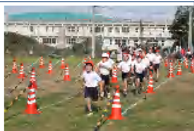
昨年の校内マラソン大会で力走する児童達の様子(於：銚田二高第二グラウンド H23.12.7)